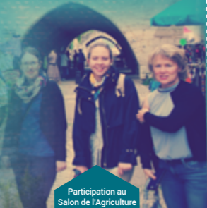
Participation au Salon de l'Agriculture avec le CDT (2020)

En partenariat avec le Comité Départemental du Tourisme de la Dordogne, nous accueillons de nombreux journalistes, bloggeurs, influenceurs... En 2022, la Dordogne a été visible sur tous les supports : cinéma, campagne TV sur France Télévisions, Des Racines et des Ailes, le Figaro... L'office de tourisme est l'expert de destination, capable de dénicher les pépites qui retiendront l'attention du journaliste et de son public.